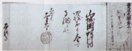
历史名将秀吉公的进贡召文