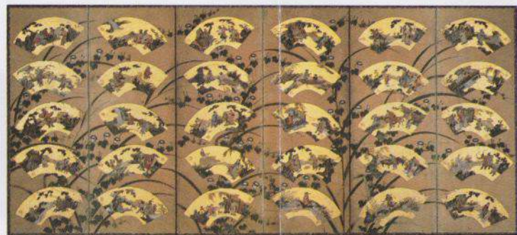
金纸唐人物扇面交织图屏风

经历过 5 次异教徒的攻击还有历史上有名的织田信长事件「本能寺的变」，本能寺至今已经历过 7 次重建。但是虽然经历过无数次的变迁和袭击有寺院的许