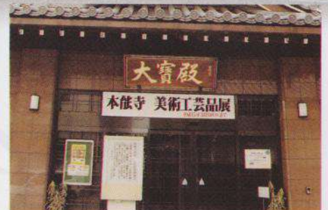
大宝殿于平成10年为了纪念法华宗开宗750诞辰所建