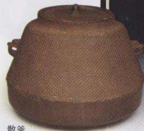
散釜， 历史名将织田公的 心爱之物