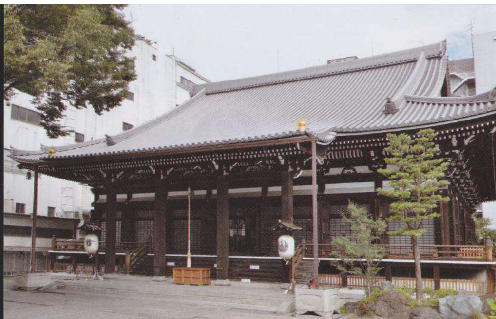
总殿堂有著名的工学博士天沼俊一先生精心设计，室町时代时聚集的木材所建，总面积有(587.4 m 2 )