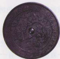
梅树椎雀文样铜镜 (重要文化财产)