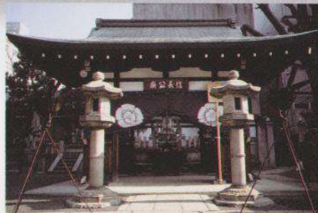
历史名将信长公庙，由信长公的三儿子信孝公所建