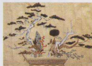
「立华」 大主持日甫上人