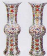
五彩龙凤花瓣文大瓶 (重要文化财产) 产地为景德镇