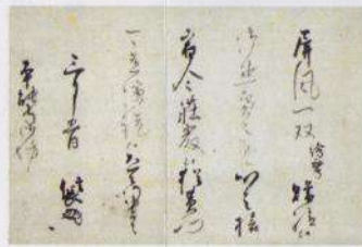
屏风礼状， 据说是历史名将织田公的亲笔