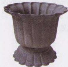
十六花瓣菊型铁水盆