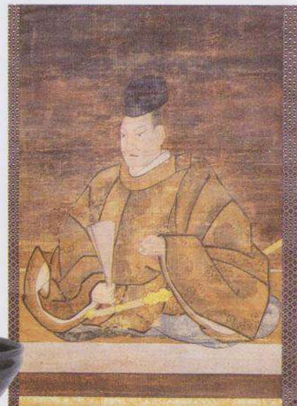
历史名将织田公的肖像