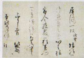
Lettre de remerciement pour des paravents, écrit par Yuan Takei et signé par Nobunaga Oda