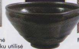
Bol à thé Tenmoku utilisé par Nobunaga Oda