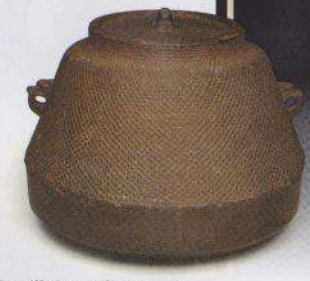
Bouilloire utilisée par Nobunaga Oda, le plus bel élément de sa collection d'ustensiles pour la cérémonie du thé