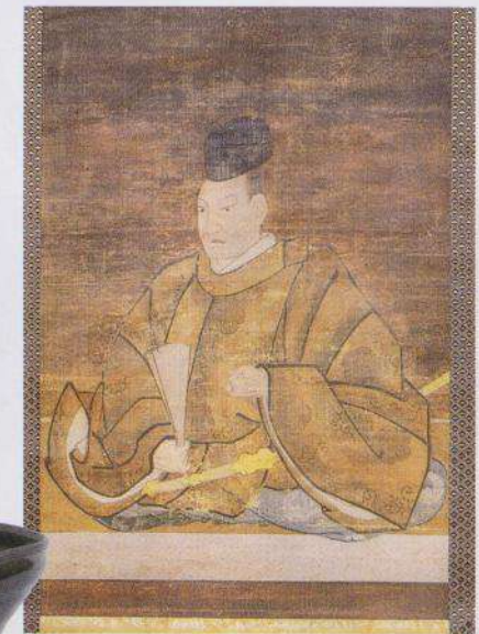
Portrait de Nobunaga Oda