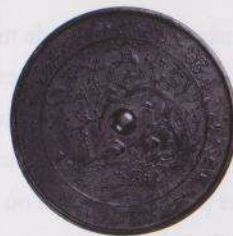
Miroir en cuivre avec motifs de pruniers, faisans et hirondelles (Bien culturel important)