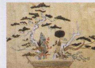
Art floral japonais par le moine bouddhiste Nippo