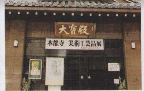
Le musée Daihoden fut construit pour la célébration du 750ème anniversaire de la branche Hokke.

Aichi, en 1534. Il prit l'initiative d'unifier le pays et fut le premier à utiliser des armes à feu lors de la bataille de Nagashino en 1575. Supporté par la Chrétienté, il établit un système économique innovant et construisit des écoles et des églises à Kyoto et Azuchi. Cependant son pouvoir et sa fortune ne durèrent pas longtemps. En Juin 1582, Mitsuhide Akechi, un de ses vassaux, fomenta une révolte et l'attaqua alors qu'il résidait au temple Honno-ji. Les troupes de Nobunaga étant largement inférieures en nombre, il réalisa que la défaite était inévitable. Il mis alors le feu au temple et se suicida de façon rituelle. Il était alors âgé de 49 ans. Nobunaga était un fidele du moine bouddhiste Nichijo qui officiait au temple Honno-ji, aussi le temple commémore sa mort depuis lors.