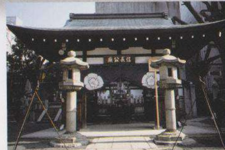
Mausolée de Nobunaga Oda, construit à la demande de son fils Nobutaka Oda.