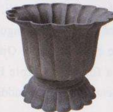
Récipient en fer en forme de chrysanthème à 16 pétales