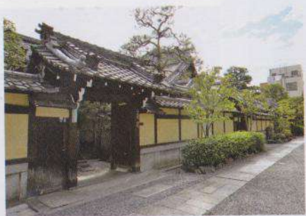
Les 7 temples annexes