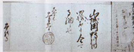
Document foncier rédigé par Hideyoshi Toyotomi