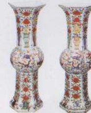
Vase à 5 couleurs représentant des fleurs, des dragons et des phoenix (Bien culturel important)