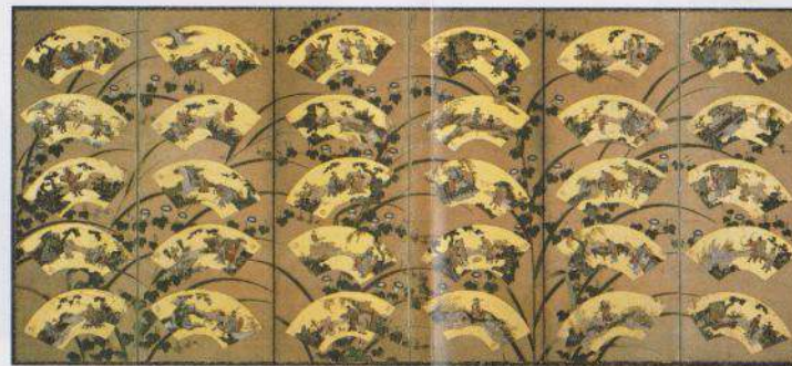
Un ensemble de paravents à six panneaux peints par Naonobu Kano

漆 Sept Le temple actuel a été reconstruit en 1928 et l'icône bouddhiste fut installé dans le temple principal le 7 Avril de cette année.