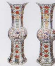
Vase à 5 couleurs représentant des fleurs, des dragons et des phoenix (Bien culturel important)