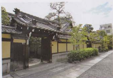
Les 7 temples annexes