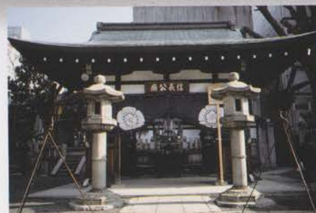
Mausolée de Nobunaga Oda, construit à la demande de son fils Nobutaka Oda.