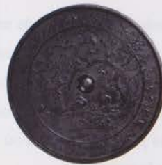
Miroir en cuivre avec motifs de pruniers, faisans et hirondelles (Bien culturel important)