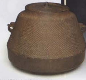
Bouilloire utilisée par Nobunaga Oda, le plus bel élément de sa collection d'ustensiles pour la cérémonie du thé