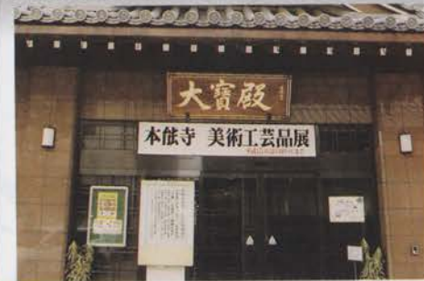
Le musée Daihoden fut construit pour la célébration du 750ème anniversaire de la branche Hokke.

Aichi, en 1534. Il prit l'initiative d'unifier le pays et fut le premier à utiliser des armes à feu lors de la bataille de Nagashino en 1575. Supporté par la Chrétienté, il établit un système économique innovant et construisit des écoles et des églises à Kyoto et Azuchi. Cependant son pouvoir et sa fortune ne durèrent pas longtemps. En Juin 1582, Mitsuhide Akechi, un de ses vassaux, fomenta une révolte et l'attaqua alors qu'il résidait au temple Honno-ji. Les troupes de Nobunaga étant largement inférieures en nombre, il réalisa que la défaite était inévitable. Il mis alors le feu au temple et se suicida de façon rituelle. Il était alors âgé de 49 ans. Nobunaga était un fidele du moine bouddhiste Nichijo qui officiait au temple Honno-ji, aussi le temple commémore sa mort depuis lors.