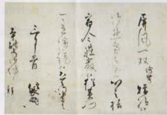
Lettre de remerciement pour des paravents, écrit par Yuan Takei et signé par Nobunaga Oda