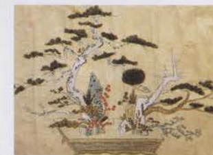
Art floral japonais par le moine bouddhiste Nippo