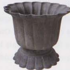
Récipient en fer en forme de chrysanthème à 16 pétales