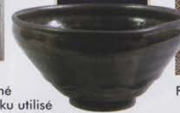
Bol à thé Tenmoku utilisé par Nobunaga Oda