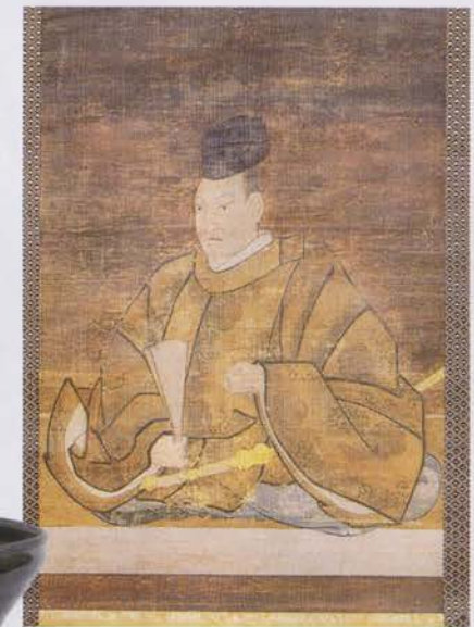
Portrait de Nobunaga Oda