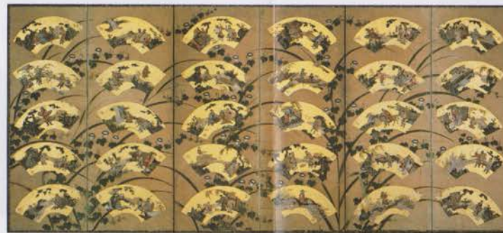
Un ensemble de paravents à six panneaux peints par Naonobu Kano

漆 Sept Le temple actuel a été reconstruit en 1928 et l'icône bouddhiste fut installé dans le temple principal le 7 Avril de cette année.