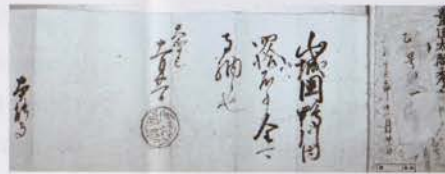
Document foncier rédigé par Hideyoshi Toyotomi